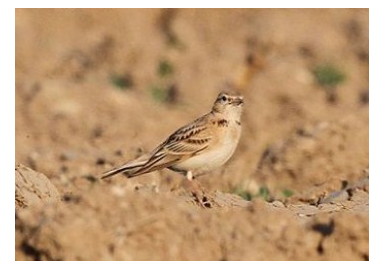
Alouette calandrelle (Jean-Pierre Jordan)