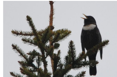
Merle à plastron (Marc Jouvie) Code Atlas 3