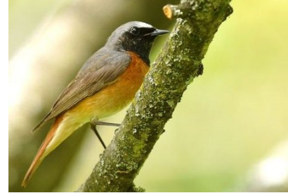
Rougequeue à front blanc (Jean Bisetti) Code Atlas 2

Quelques espèces manifestant des chants accompagnés de vols de parades indiquant un indice de nidification probable (code 6)