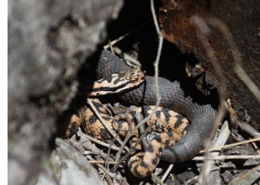
Vipère aspic (Manuel Ruedi)

Nombre de communes visitées en avril : 183/295