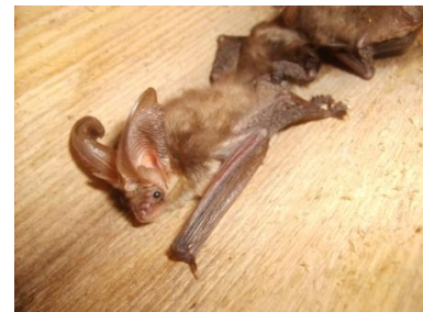
Oreillard roux (Christian Prevost)