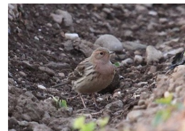
Pipit à gorge rousse (Jean-Pierre Jordan)