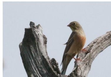
Bruant ortolan (Mathieu Robert)