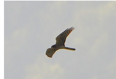
Busard cendré (Stéphane Henneberg)