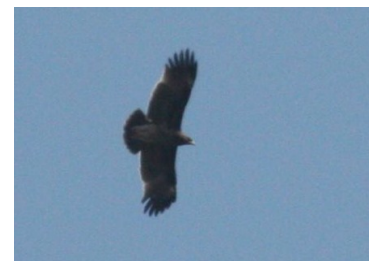
Aigle criard (Alexis Pochelon)