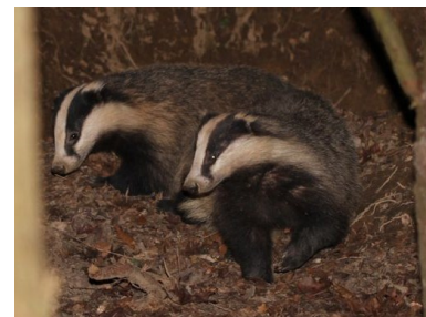
Blaireau européen (Dominique Edon)

La LPO Haute-Savoie reste à votre disposition pour toute question technique relative à l'utilisation du site Internet. N'hésitez pas à nous contacter au 04 50 27 17 74 ou haute-savoie@lpo.fr