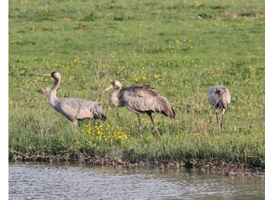
Grues cendrées

* Sous réserve d'homologation par le CHR ou le CH