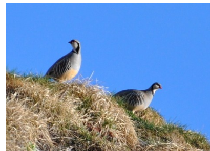
Perdrix bartavelle (Pascal Charrière) Code Atlas 4