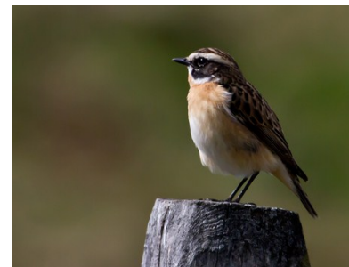
Tarier des prés (Pierre Jouvenat)