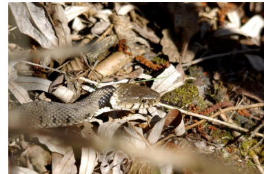
Couleuvre à collier (Bernard Kientz)