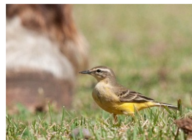
Bergeronnette printanière (Mathieu Robert)