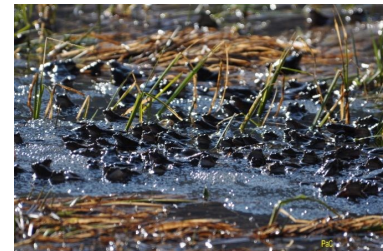
Grenouille rousse (Pascal Charrière)

Au programme : expositions, balades naturalistes à la recherche de la faune riche et diversifiée des zones humides. RDV à votre convenance, entre 10h et 17h, aux étangs de Beaumont Crosagny sur la commune de Saint-Félix. Renseignements à la LPO 74 au 04 50 27 17 74 ou haute-savoie@lpo.fr