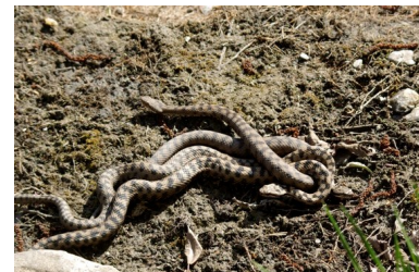
Vipère aspic (Bernad Kientz)

Retrouvez l'intégralité du programme des activités du 2ème trimestre dans la rubrique Vie associative / Sur votre agenda