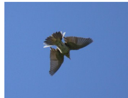
Pipit des arbres (Arnaud Lathuille) Code Atlas 6