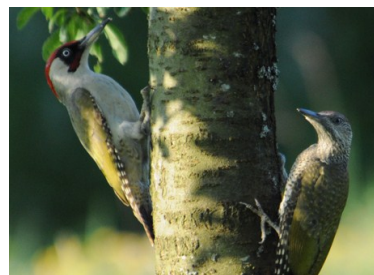
Pic vert (Remy Lamy-Chappuis)