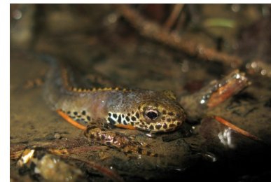
Triton alpestre (Antoine Guibentif)

Un nouveau rendez-vous au domaine de Guidou en ce printemps, pour observer les divers oiseaux d'eau en halte migratoire et écouter les passereaux fraîchement arrivés marquer leurs territoires par leurs chants. Sortie d'initiation. RDV à 8h à la mairie de Sciez pour une matinée d'observation. Renseignements auprès de Jean-Jacques Beley au 04 50 70 80 45 ou jean-jacques.beley@wanadoo.fr