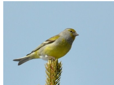
Venturine montagnard (Pascal Charrière)