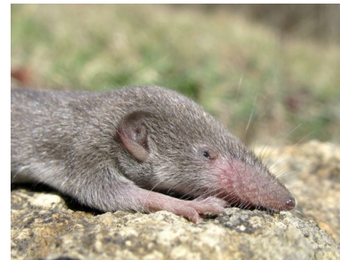
Musaraigne musette (Antoine Guibentif)

Retrouvez l'intégralité du programme des activités du 2 ème trimestre dans la rubrique Vie associative / Sur votre agenda