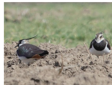
Vanneau huppé (Severine Gaudeau)