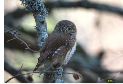
Chevêchette d'Europe (Pascal Charrière)