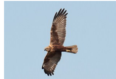
Busard des roseaux (Jeremy Calvo)