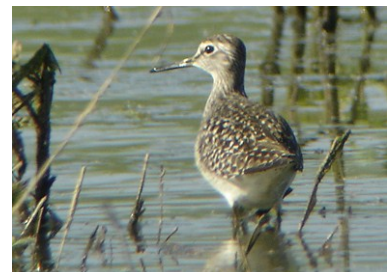
Chevalier sylvain (David Rey)

La LPO Haute-Savoie reste à votre disposition pour toute question technique relative à l'utilisation du site Internet. N'hésitez pas à nous contacter au 04 50 27 17 74 ou haute-savoie@lpo.fr