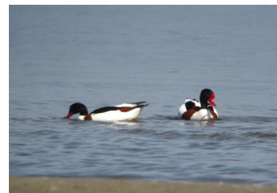
Tadorne de Belon (Pascal Charrière)