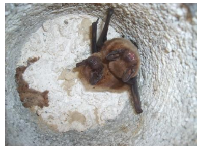
Noctule de Leisler (Christian Prévost)