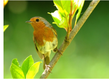
Rougegorge familier (Jean Bisetti)

Pour plus d'informations sur le programme : http://www.oiseauxdesjardins.fr/