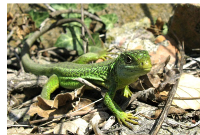
Lézard vert (Antoine Guibentif)