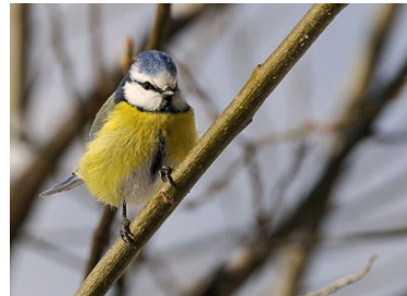
Mésange bleue (Fridolin Schwitter)