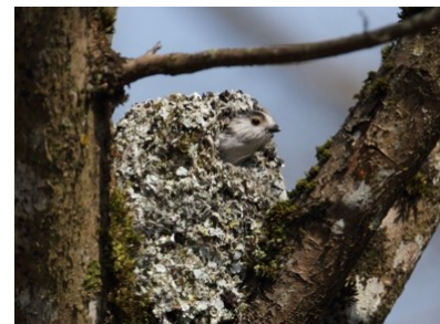
Mésange à longue queue (Robin Berton)