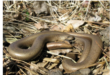
Orvet fragile (Antoine Guibentif)