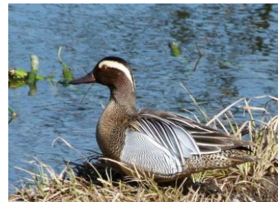
Sarcelle d'été (Claudie Desjacquot)

1 individu le 10 au port de Séchex (Margencel) (R. Jordan).