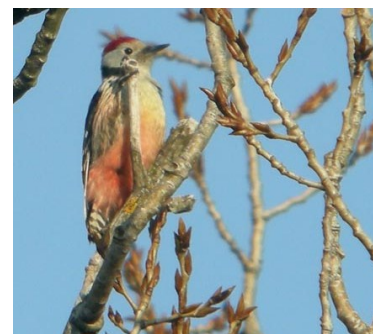
Pic mar (Christophe Rochaix)