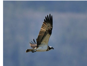
Balbuzard pêcheur (Alain Chappuis)

* Sous réserve d'homologation par le CHR ou le CHN