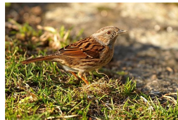
Accenteur mouchet (Jean Bisetti)