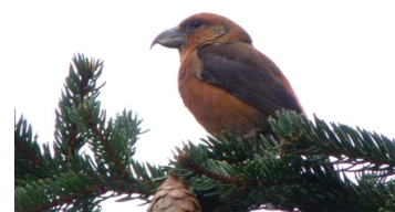
Bec-croisé des sapins (Robin Berton)