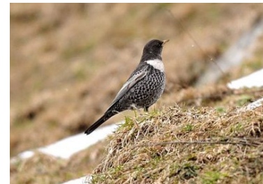
Merle à plastron (Jean Bisetti)