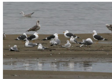
Goélands bruns (Raphaël Jordan)