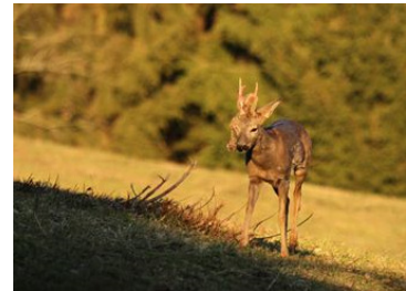
Chevreuil (Arnaud Lathuille)