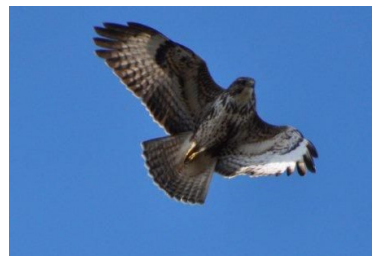
Buse variable (Monique Belville)

Enfin on privilégiera l'utilisation des codes atlas 1 à 19 et on évitera, dans la mesure du possible, d'utiliser les codes 30, 40 et 50.