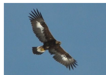
Aigle royal (Monique Belville)

Le coin des ornithos Le coin des naturalistes A propos Les prochains RDV