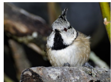
Mésange huppée (Fridolin Schwitter)