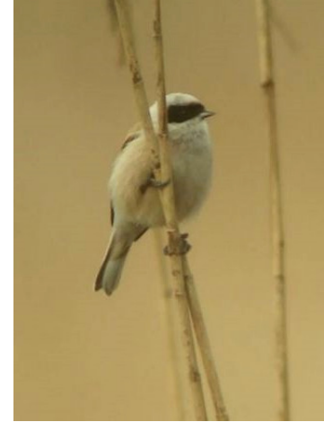
Rémiz penduline (Thierry Vibert-Vichet)