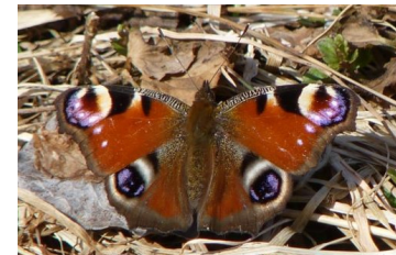
Paon du jour (Robin Bierton)