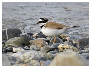
Petit gravelot

Pour participer à cette enquête il vous suffit de saisir vos observations concernant ces espèces en utilisant le mode de saisie par localisation précise.