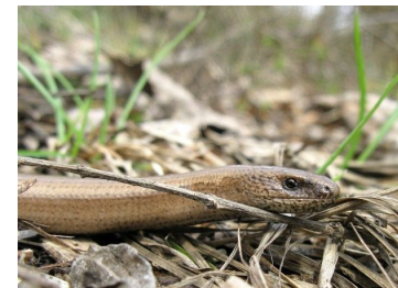
Orvet fragile (Antoine Guibentif)

Nombre de communes visitées en mars : 118/295