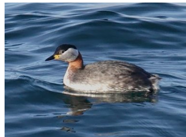
Grèbe jougris (Séverine Gaudeau)

Le 22 mars à Moulin Rouge (Annecy) 1 Tichodrome échelette (D. Maricau), 1 Huppe fasciée à le By (Scientrier) (A. Guibentif) et à Arrêt (Hauteville-sur-Fier) (B. Baranger).