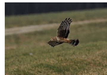
Busard Saint-Martin (Jean Bisetti)

La LPO Haute-Savoie reste à votre disposition pour toute question technique relative à l'utilisation du site Internet. N'hésitez pas à nous contacter au 04 50 27 17 74 ou haute-savoie@lpo.fr