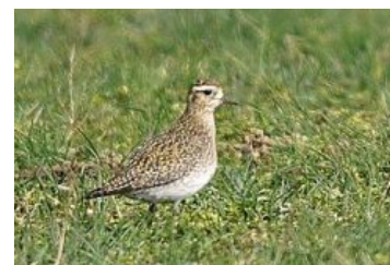
Pluvier doré (Jean Bisetti)