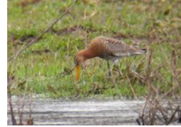
Barge à queue noire (Xavier Birot-Colomb)

* Sous réserve d'homologation par le CHR ou le CHN