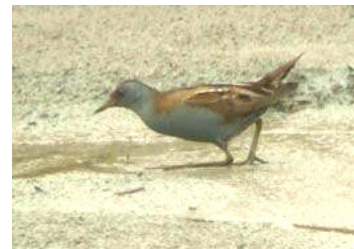
Marouette poussin (Thierry Vibert-Vichet)