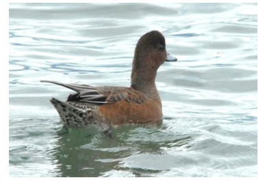
Canard siffleur (A. Guibentif)