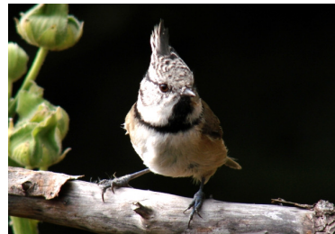
Mésange huppée (R. Bierton)

Le 30 octobre à Vers la Plaigne (Taninges), 6 Grives mauvis (P. Charrière).