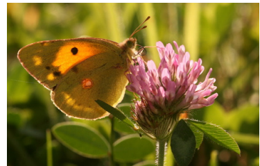
Souci (Y. Fol)