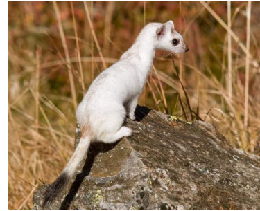
Hermine (JP. Delobelle)

Nombre de communes visitées en octobre : 81