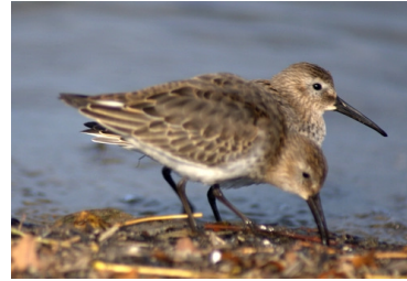
Bécasseaux variables

Retrouvez l'intégralité du programme des activités du 4 ème trimestre dans la rubrique Vie associative / Sur votre agenda