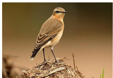
Traquet motteux (J. Bisetti)