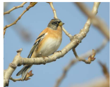
Pinson du Nord (C. Rochaix)