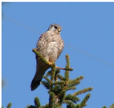
Faucon crécerelle (R. Bierton)