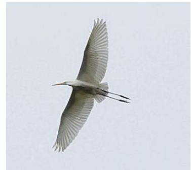
Grande aigrette (J. Bisetti)

Le coin des ornithos Le coin des naturalistes A propos Les prochains RDV