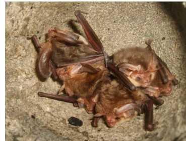
Oreillard roux (C. Prévost)