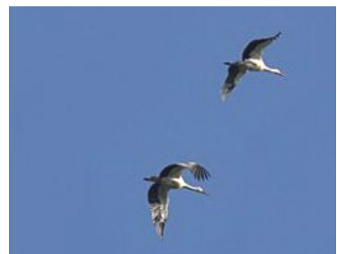
Cigognes blanches (J Bisetti)