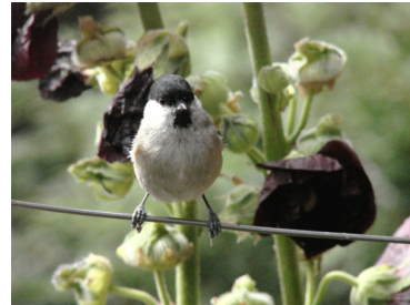
Mésange nonette (R. Bierton)