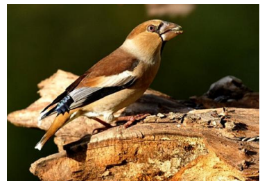
Grosbec casse noyaux (J Bisetti)

Nous vous rappelons que la LPO Haute-Savoie assure une permanence d'accueil tous les après-midi de 13h à 17h.