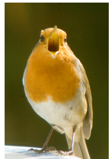
Rouge-gorge familier (Fabrice Bailleul)