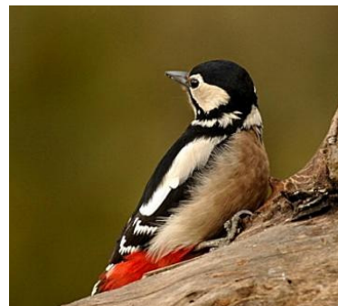
Pic épeiche (Jean Bisetti)