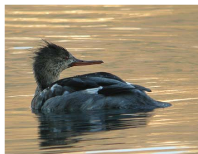
Harle huppé (Christophe Rochaix)