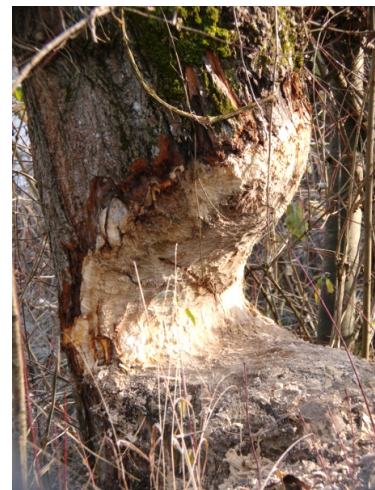
Traces de Castor (Robin Bierton)