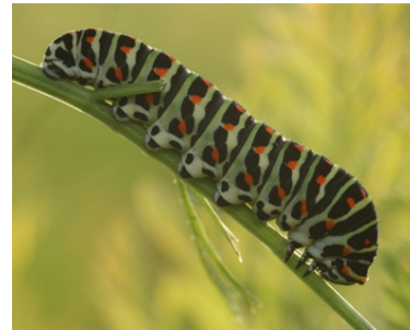
Chenille de Machaon (Yves Fol)

Il est intéressant également de préciser le type de traces rencontrées afin de mieux interpréter l'observation.