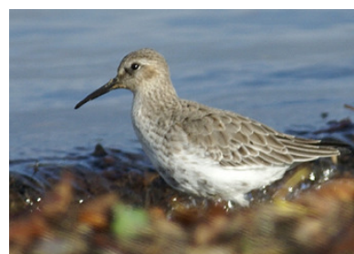
Bécasseau variable (David Rey)