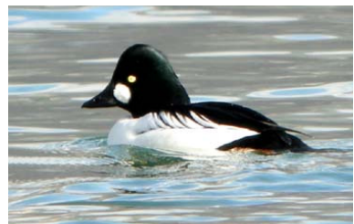
Garrot à œil d'or

Le 30 novembre à Vers la Fruitière (Usinens) 2 Busards Saint-Martin mâles en chasse (D. Secondi), à l'Etournel (Vulbens) 4 Oies cendrées , 91 Canards siffleurs , 3 Canards pilets , 1 Canard souchet , 4 Grandes Aigrettes et 2 Cigognes blanches (J.P. Matérac) et à Saint-Eusèbe 1 Busard Saint-Martin (E. Nougarede).