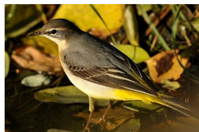
Bergeronnette des ruisseaux (Jean Bisetti)