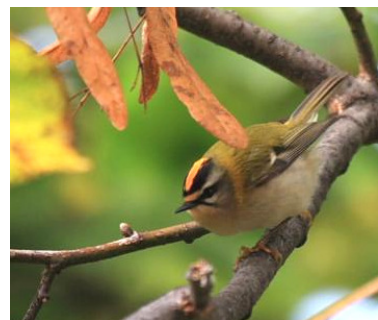
Roitelet à triple bandeau

Retrouvez l'intégralité du programme des activités du 4ème trimestre dans la rubrique Vie associative / Sur votre agenda