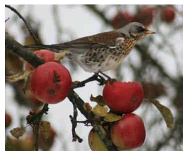
Grive litorne (Daniel Rodrigues)

Le coin des ornithos Le coin des naturalistes A propos Les prochains RDV