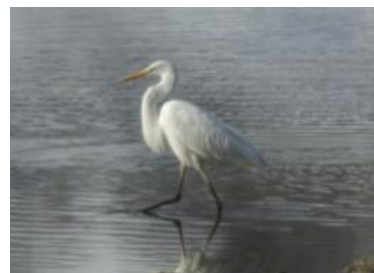
Grande Aigrette (Bernard Kienst)