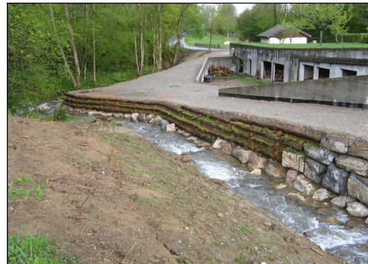
Le Pamphiot avant et après action du contrat de rivière.