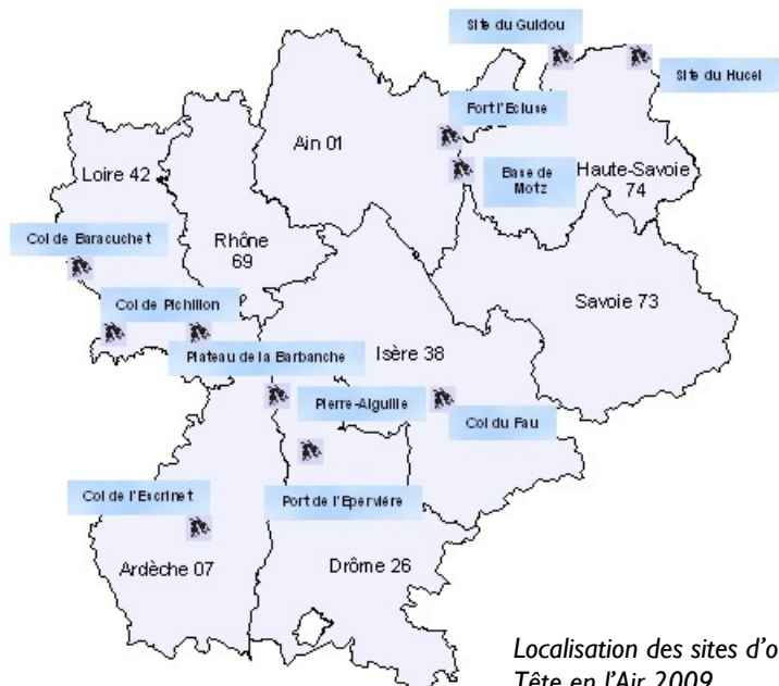
Localisation des sites d'observation et d'animation de l'opération Tête en l'Air 2009