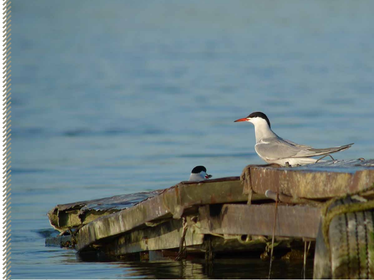
Sterne pierregarin

Rédaction : Jean-Philippe Paul – mise à jour : avril 2011