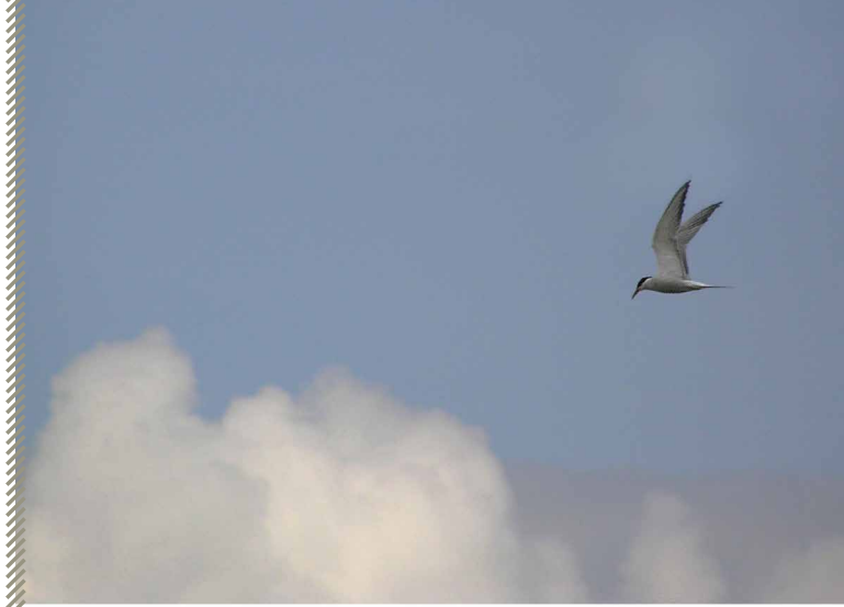
Sterne pierregarin

Notons que la population de basse vallée du Doubs entre Franche-Comté et Bourgogne est distincte et isolée alors que la nidification dans le Territoire de Belfort est vraisemblablement à rattacher à la population rhénane alsacienne.