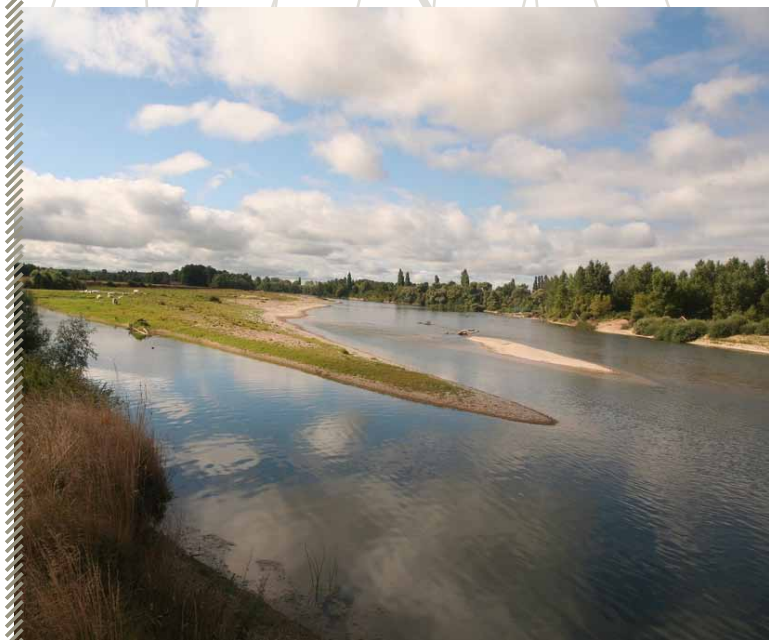
Habitat naturel de la Sterne pierregarin