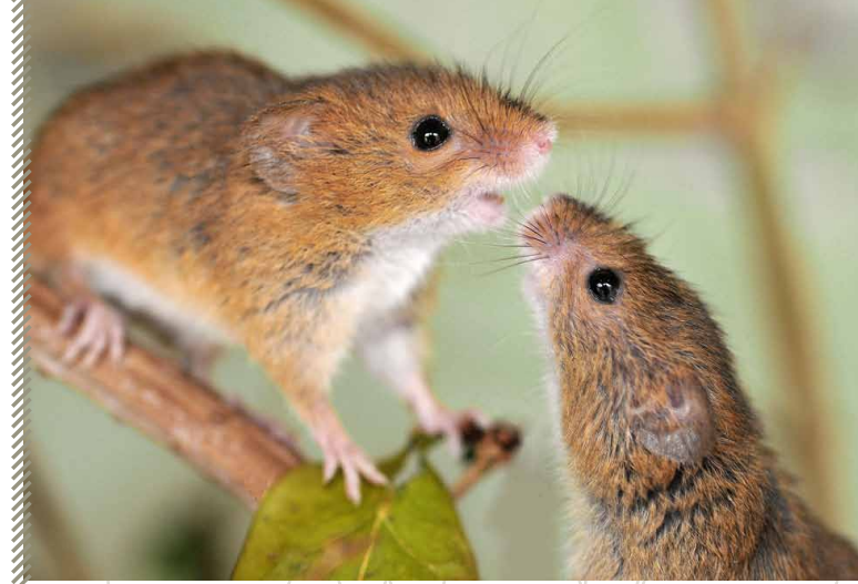
Rat des moissons

Espèces active toute l'année, de jour comme de nuit, elle se nourrit principalement de graines, de végétaux et parfois d'insectes.