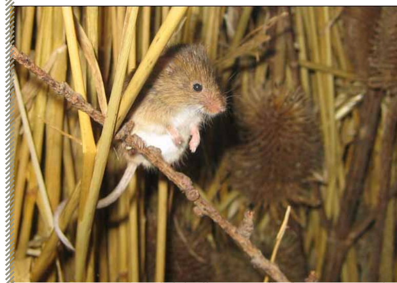
Rat des moissons

Rédaction : Christophe Morin- mise à jour cartographique : août 2011