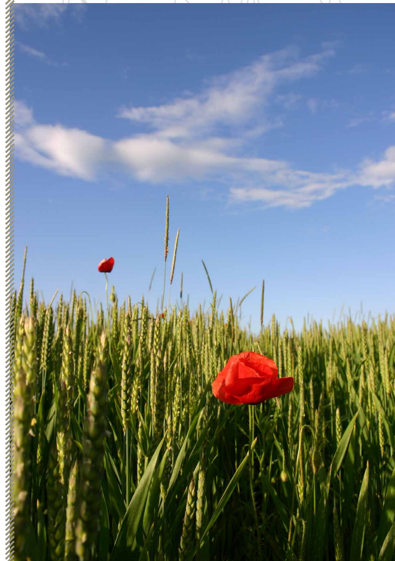
Habitat type du Rat des moissons