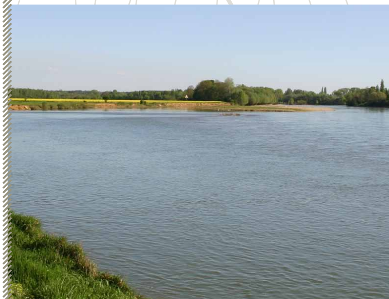
Habitat naturel de l'espèce