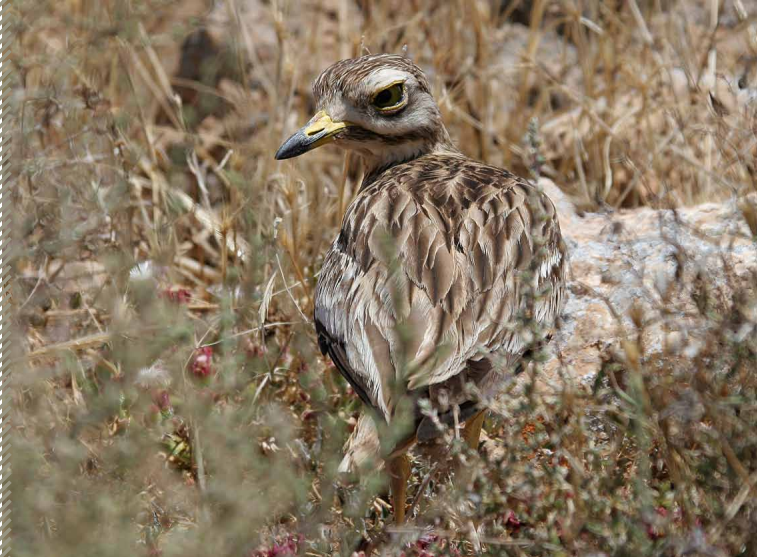
Oedicnème criard