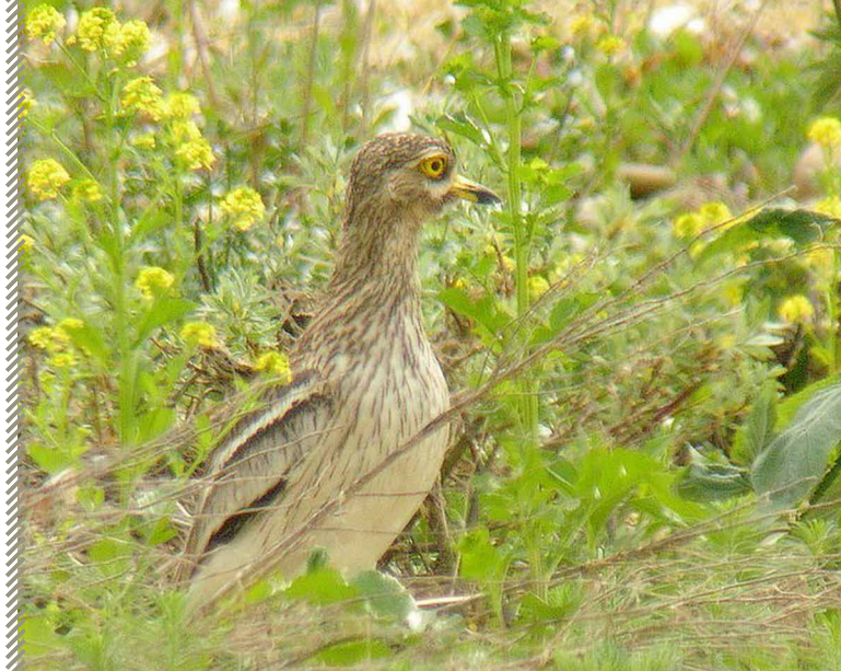
Oedicnème criard

Rédaction : Jean-Philippe Paul – mise à jour : avril 2011