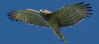
Circaète Jean-le-Blanc

Spécialiste, le Circaète consomme des Reptiles et notamment des serpents. On estime qu'il faut 700 serpents pour nourrir un couple et son jeune entre mars et septembre, ce qui illustre l'importance de cette ressource alimentaire et surtout la qualité des habitats à reptiles. Facteur limitant, cette ressource explique le faible taux de reproduction de l'espèce (un seul œuf pondu pour un succès faible souvent de 0,5 jeune à l'envol par couple).