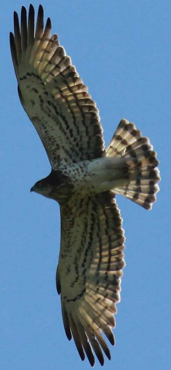
Circaète Jean-le-Blanc

Rédaction : Jean-Philippe Paul – mise à jour : février 2011