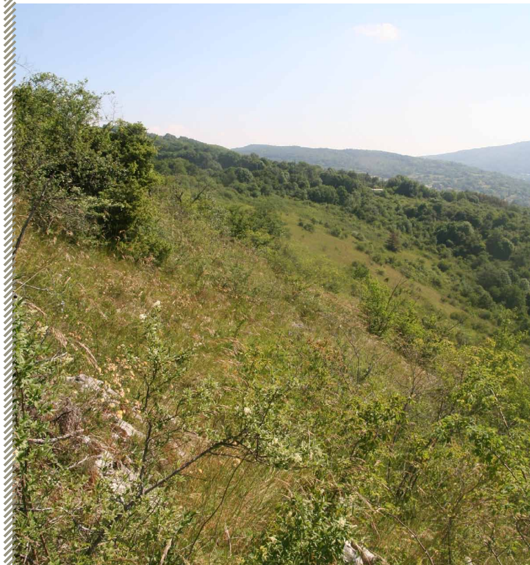
Zone de chasse