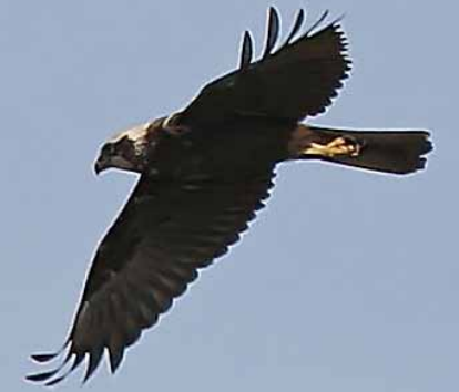
Busard des roseaux mâle

Rédaction : Jean-Philippe Paul - Mise à jour : avril 2011