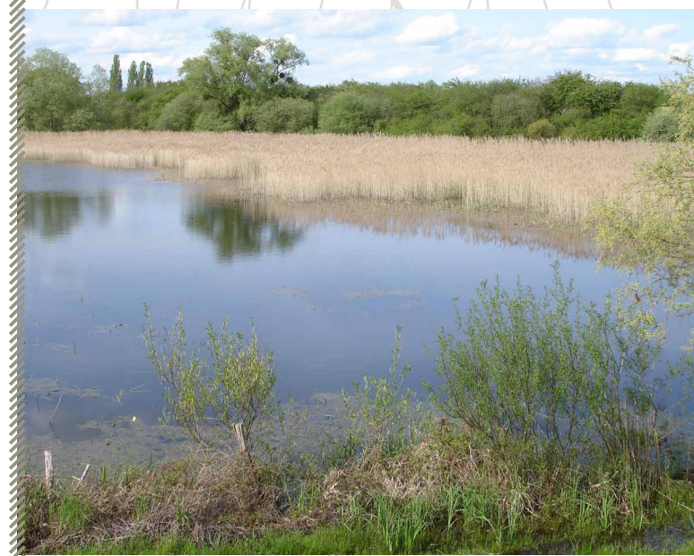
Roselière, milieu de nidification