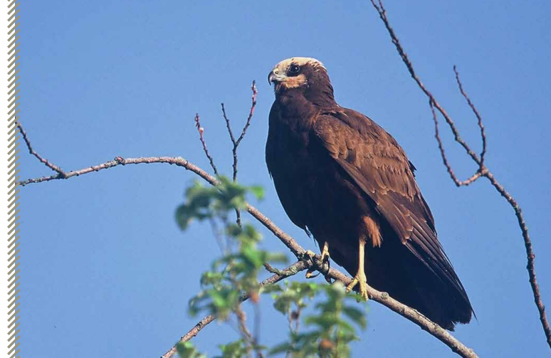
Busard des roseaux femelle

Le régime alimentaire est méconnu dans la région mais l'espèce est en général éclectique et même charognard, ce qui lui permet d'être moins lié que les autres busards aux fluctuations de ses ressources alimentaires.