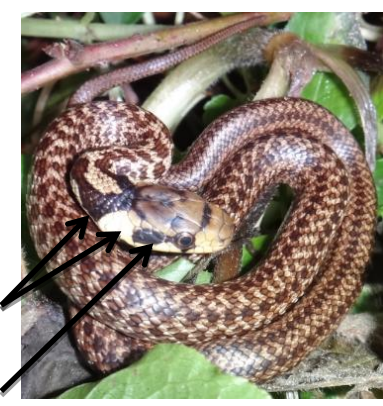
Jeune Dos tacheté de clair sur fond brun-gris ou gris-vert 1 petite bande noire derrière l'œil Collier jaune délimité par une tache brune en U inversé derrière la nuque

Défense : généralement placide, elle s'éloigne discrètement mais cherche parfois à mordre si elle est acculée . Peut aussi émettre un produit malodorant