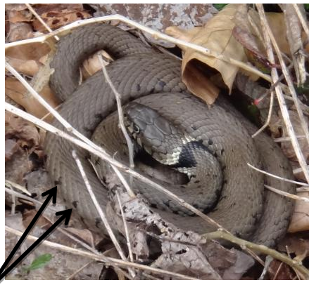
Serpent gris à brun avec un collier noir / blanc distinctif +/- visible sur le cou

Jeunes : répliques miniatures des adultes