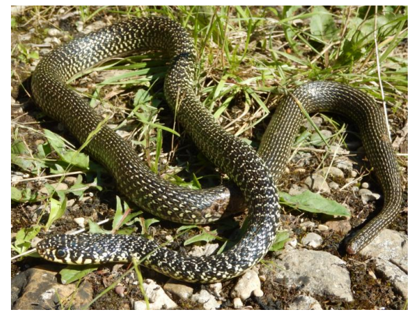
Adulte : grand serpent d'aspect vert sombre tacheté de jaune clair Corps noir ou vert foncé avec des taches pâles formant des barres transversales sur l'avant du corps et des lignes longitudinales sur la partie postérieure et la queue