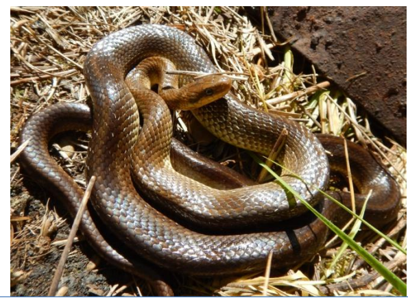
Adulte Très grande couleuvre d'aspect brillant vert olive à marron au ventre jaune immaculé Dessus du corps souvent constellé de points blancs