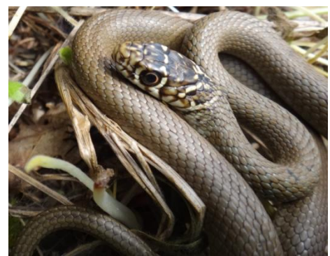
Jeune Seule la tête noire à dessins clairs rappelle l'adulte Dos gris-olivâtre et ventre blanc jaunâtre

Défense : acculée, fait souvent face à son agresseur et peut essayer de mordre avant de fuir rapidement si elle est inquiétée