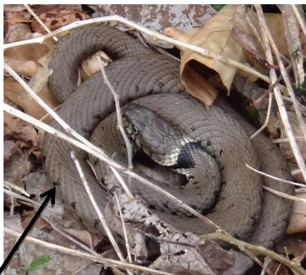
Serpent gris à brun avec un collier noir / blanc distinctif +/- visible sur le cou

Jeunes : répliques miniatures des adultes