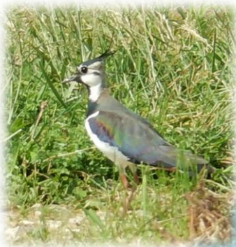
Image à droite : Nid de Vanneaux huppé sur le point d'être détruit.

Photos à gauche : Vanneau huppé ;