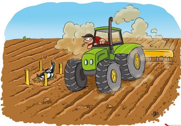
Nid de Vanneau huppé protégé par les 4 piquets

En partenariat avec les agriculteurs, deux mesures de protection sont principalement mises en place par la LPO : le contournement du nid pour les vanneaux huppés et la fauche retardée pour les espèces nichant en prairie.