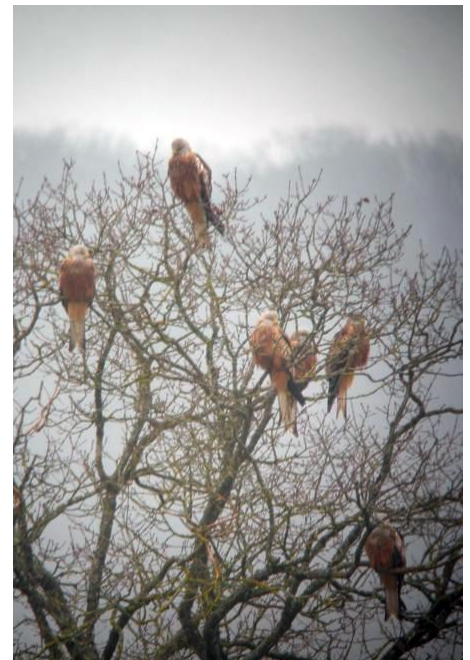
Milans royaux en dortoirs

Noté intermédiaire rédigée par : Samuel Maas ( samuel.maas@lpo.fr )