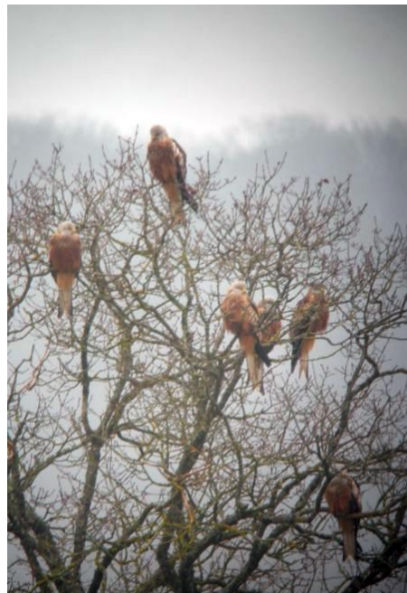
Milans royaux en dortoirs

Noté intermédiaire rédigée par : Mariane Benoit ( mariane.benoit@lpo.fr )